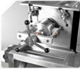
نظام إغلاق وفتح الحركة النواسية بشكل سهل للصيانة ولتبادل المنخل

easy open/close system for maintenance and mesh change